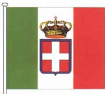
Bandiera Regno di Sardegna (1848-1861) Regno d'Italia (1861-1946)