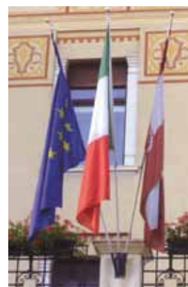
Esposizione delle bandiere su tre aste

no stato e correttamente dispiegate»; su ciascuna asta, di norma, deve trovare posto una sola bandiera. Infine, l'articolo 292 del Codice Penale punisce chiunque vilipenda la bandiera nazionale o i colori nazionali.