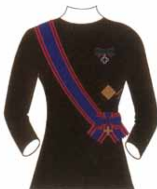
Abito femminile da cerimonia e da sera