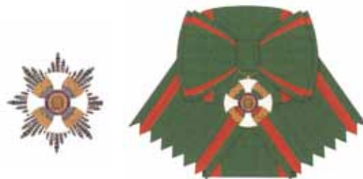
Maschile e Femminile