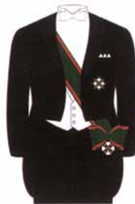
Frac da sera