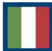
Stendardo del presidente Cossiga